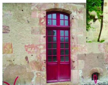
Menuiserie mouton et gueule de loup