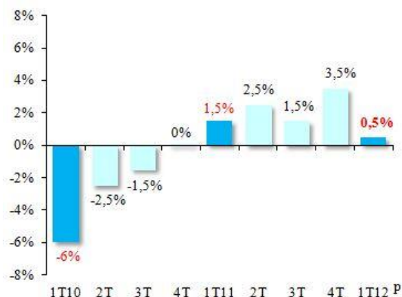
Evolution du volume d'activité (2) des entreprises artisanales au 1 er trimestre 2012 : +0,5 %

Patrick Liébus, Président de la CAPEB, déplore : « L'arrêt de 3 à 4 semaines des chantiers au mois de février a créé un véritable trou d'air. L'application des plans de rigueur décidés en 2011 n'améliorera pas la situation du secteur avec le recentrage du PTZ+, la disparition du dispositif Scellier et la hausse du taux réduit de TVA de 5,5 % à 7 % ».