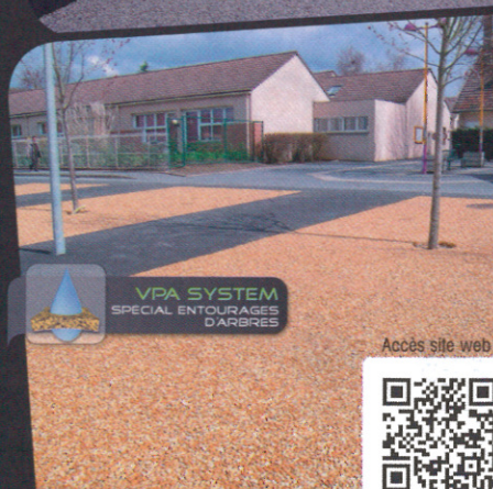
VPA SYSTEM SPECIAL ENTOURAGES D'ARBRES