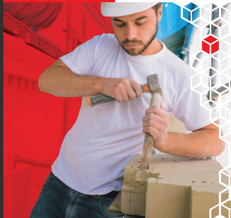
Conception CAPEB - Pays de la Loire - Photos : © Olivia Arthur / Magnum photos, © Stocklib / kasto