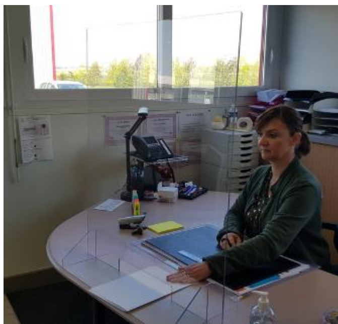
Modèle « bas » hauteur 60 cm