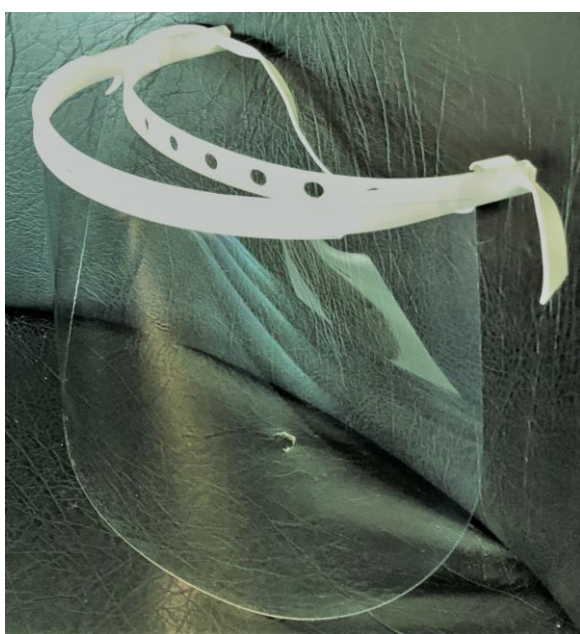
Visières pour le BTP