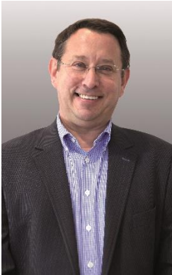
Président du Jury des Trophées des artisans du Patrimoine et de l'Environnement Président CAPEB Auvergne-Rhône-Alpes