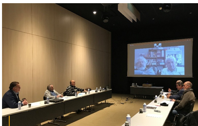
Délégation des représentants des Couvreurs - Plombiers - Chauffagistes