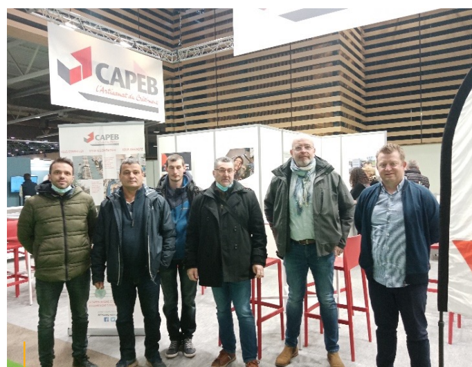
Délégation de la Haute-Loire