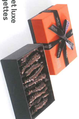
Coffret luxe orangettes 200 g 900019

Orange Navet confite enrobée de chocolat noir et parsemée de grains de nougatine.