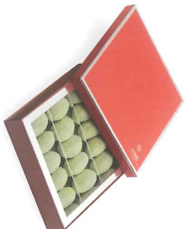
Boîte de 15 nougamandines 200 g 900011

Pavé de nougatine croquante, fourré d'un praliné amande- noisette et saupoudré de poudre d'amande.