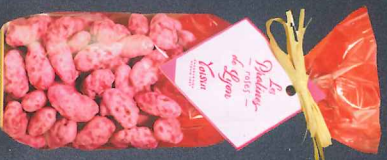
Sachet de pralines roses de Lyon 200 g 900188 A

C'est dans un chaudron de cuivre que les amandes sont délicatement torréfiées puis enrobées à la louche d'une fine couche de sucre.