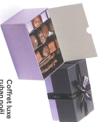
Coffret luxe ruban Noël 250 g 900072 350 g 900073