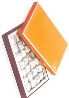
Boîte de nougastelles x18 - 190 g 9000225 x28 - 300 g 9000226

Pavé de nougatine croquante, fourré d'un praliné amande- noisette et saupoudré de poudre d'amande.