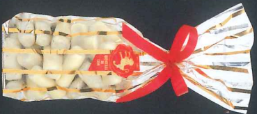
Pochette quenelles 200 g 900188

C'est un duo de pralinés, l'un onctueux, pur noisettes du Piémont, l'autre croustillant, pur amandes de Valencia. Le tout finement enrobé de chocolat blanc.