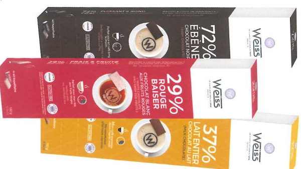
Réglette napolitains rouge baiser 180 g 900010G

Choisissez de faire plaisir ou de vous faire plaisir avec les napolitains Weiss qui sauront accompagner vos instants café avec gourmandise.