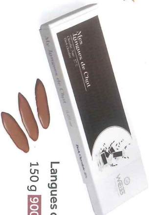
Langues de chat 150 g 900138