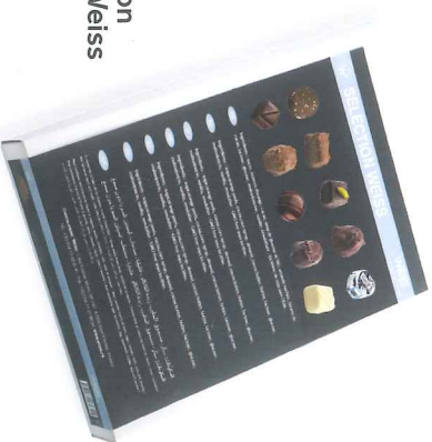
Boîte sélection des ateliers Weiss 1 kg 900091

Assortiment ganaches et pralinés, le savoir-faire de Weiss réuni dans ses assortiments.