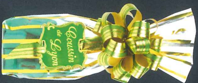
Sachet coussins 250 g 900187

C'est un duo de pralinés, l'un onctueux, pur noisettes du Piémont, l'autre croustillant, pur amandes de Valencia. Le tout finement enrobé de chocolat blanc.