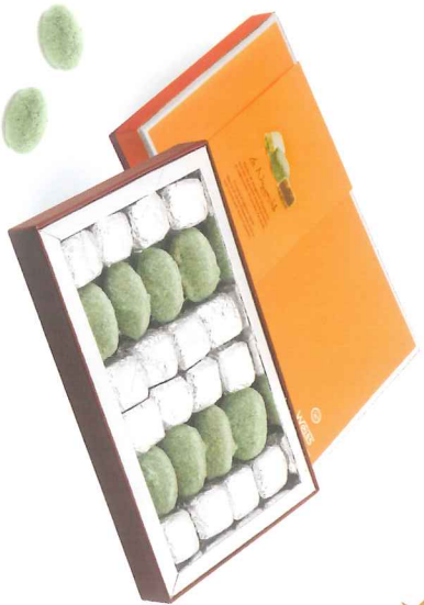
Coffret 16 nougastelles et 8 nougamandines 270 g 900011 A