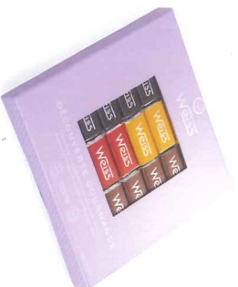
Coffret napolitains découverte gourmande 240 g 900010

Orange Navet confite enrobée de chocolat noir et parsemée de grains de nougatine.