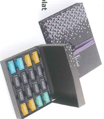
Coffret Haut Chocolat 64 napolitains 288 g 900010H