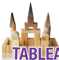
TABLEAU DE REMBOURSEMENT