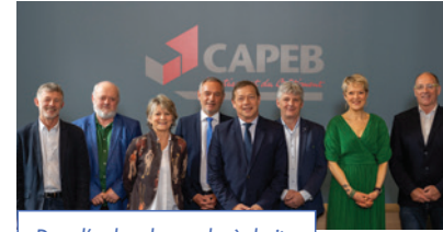
Dans l'ordre, de gauche à droite :