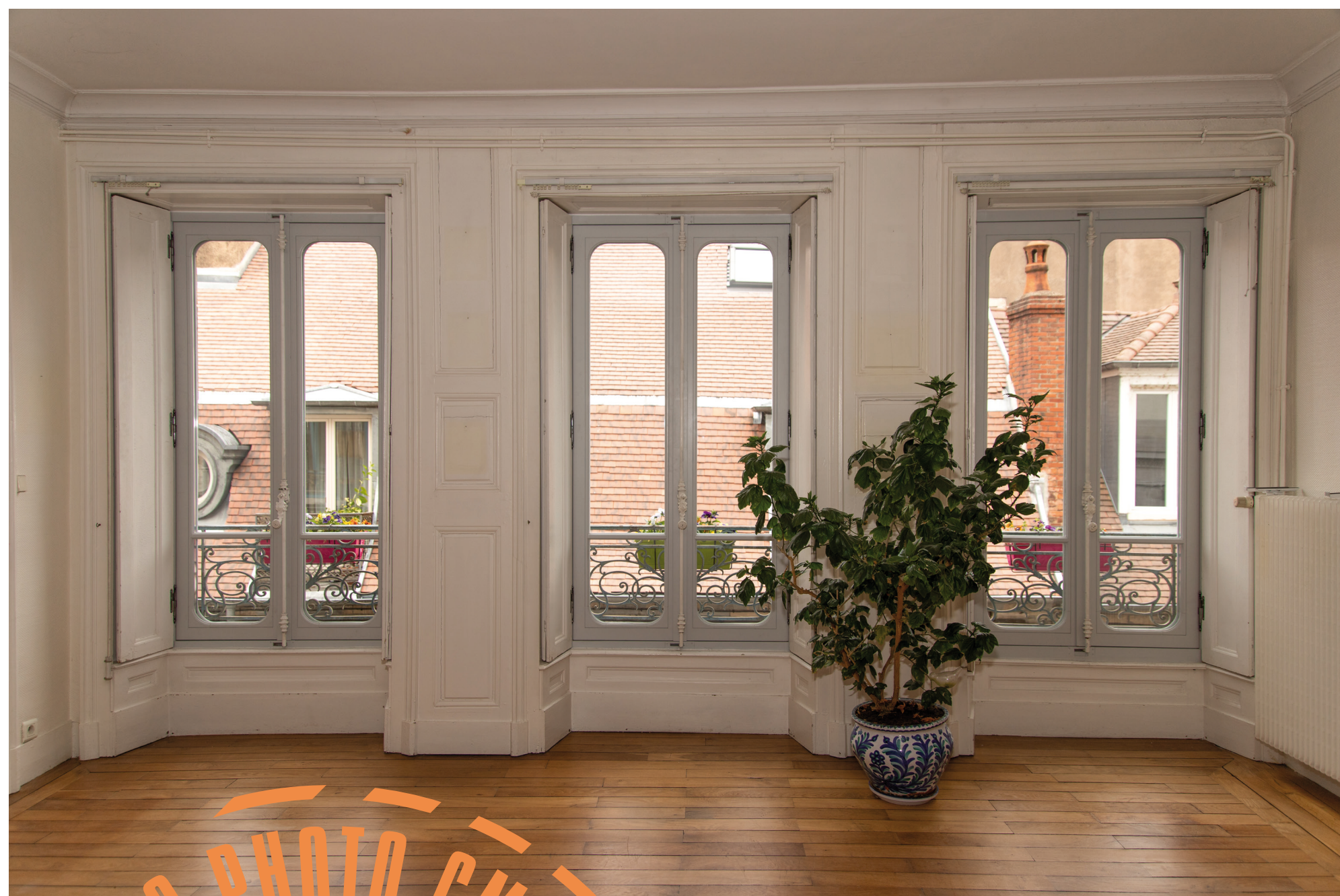
2 Bâtiment du centre historique de Besançon (25) Vue intérieure, menuiserie à l'ancienne avec essences de bois locaux. Quincaillerie d'origine.