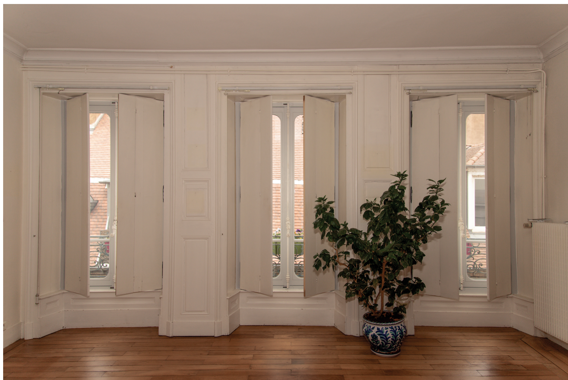
3 Bâtiment du centre historique de Besançon (25) Vue intérieure, menuiserie à l'ancienne avec essences de bois locaux. Quincaillerie d'origine.