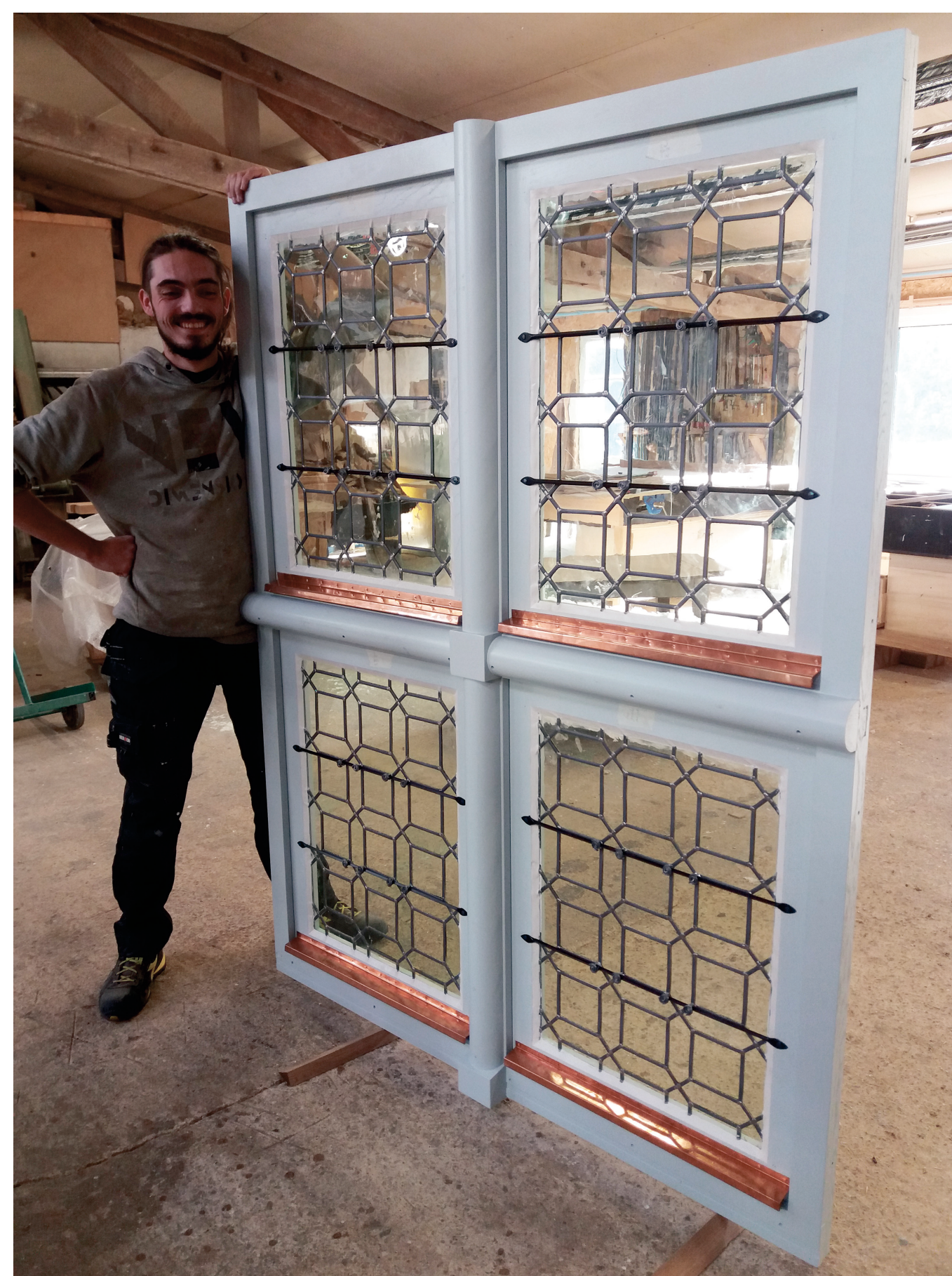
4 Atelier Menuiserie de la Charnie, Parennès (72) Fin de fabrication, menuiserie prête à poser.