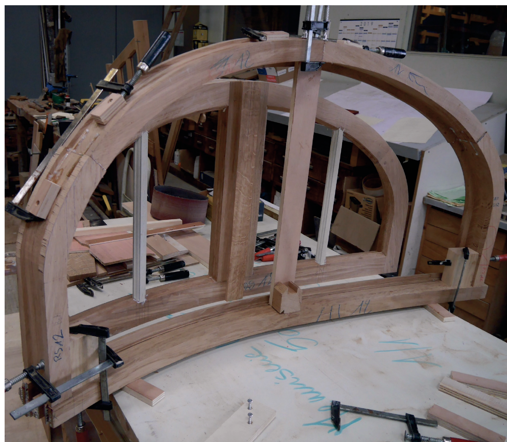
Atelier de l'entreprise Option Bois à Pont Hébert (50) Au premier plan : Montage par collage de la partie haute du bâti destiné à recevoir l'imposte. Au second plan : Imposte destinée à être intégrée dans le bâti.