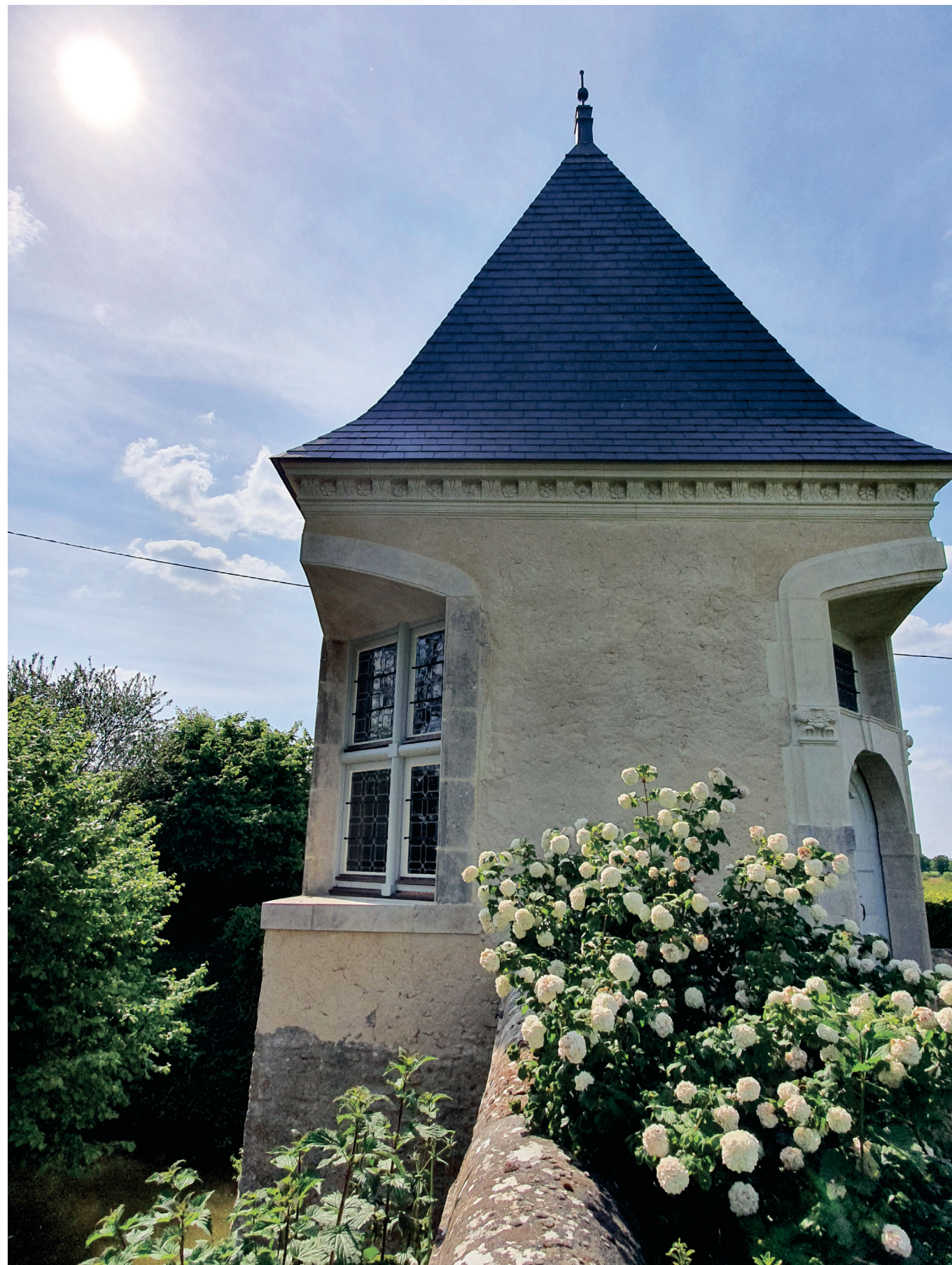
1 Manoir de Guiberne, Vallon sur Gée (72) 2 châssis de fenêtre à croisée de meneaux bois et d'une porte à panneaux pointe de diamant.