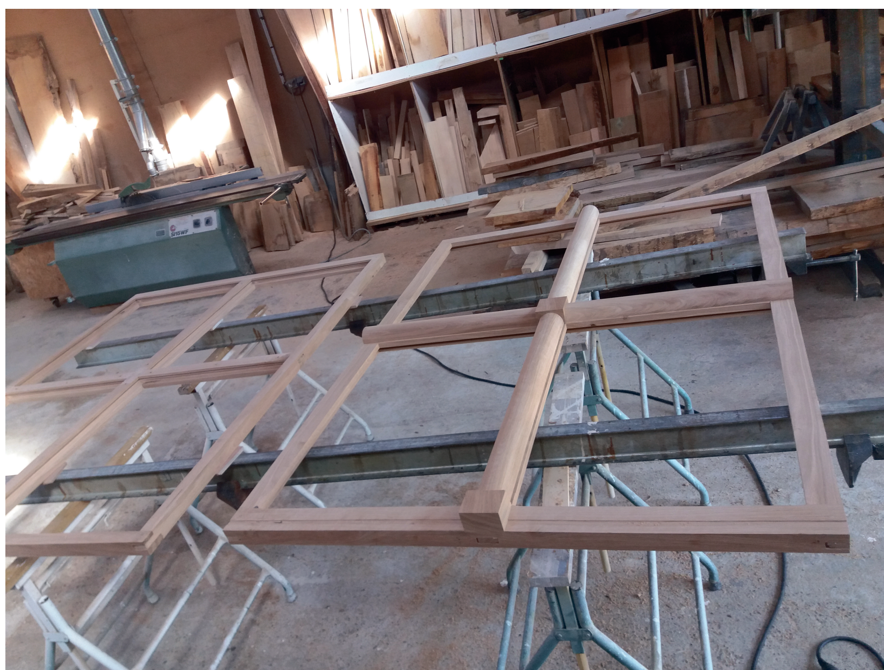
3 Atelier Menuiserie de la Charnie, Parennès (72) Photo des dormants avec les meneaux bois avant.