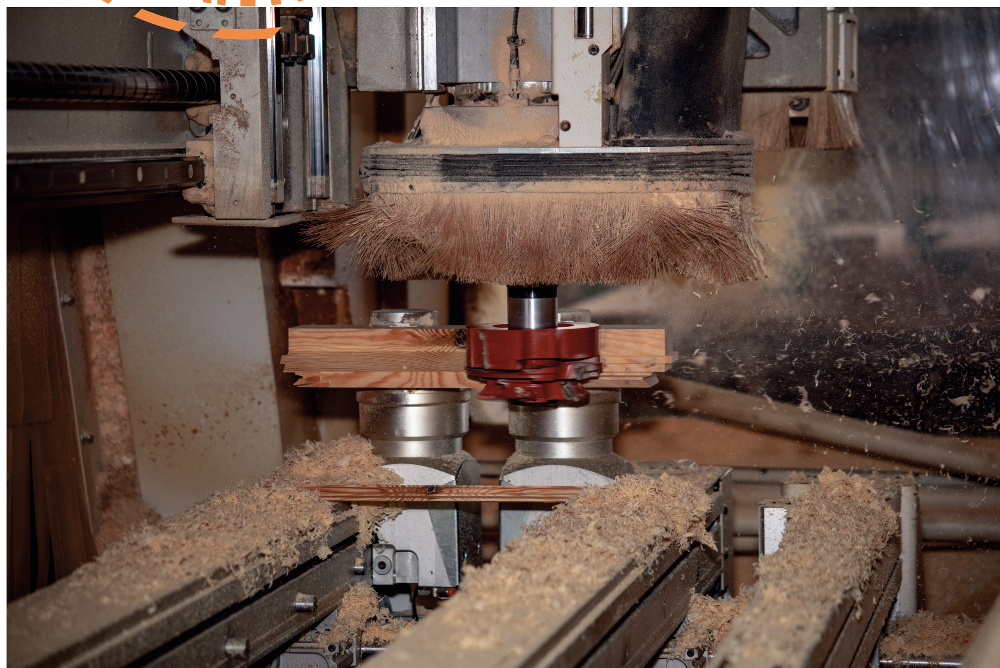
4 Prise de vue à l'atelier