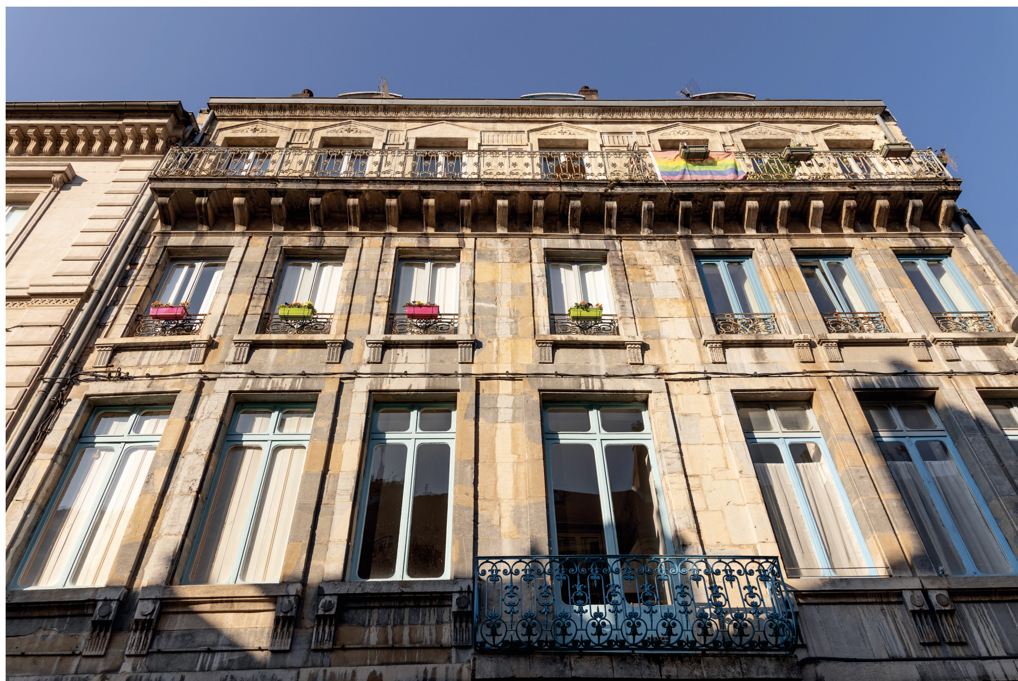
Bâtiment du centre historique de Besançon (25)