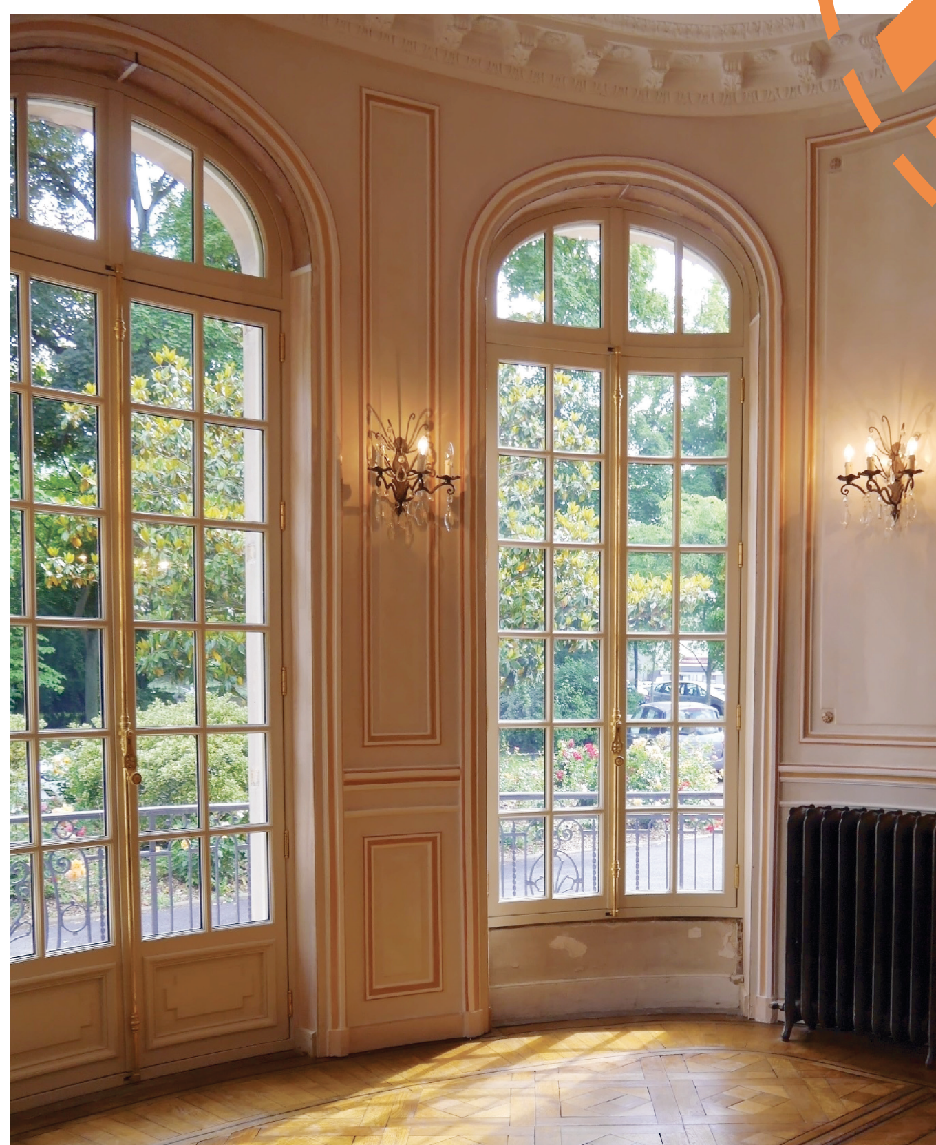
Hôtel de Ville de Gonesse (95) Vue intérieure de l'intégration de la fenêtre dans le bâti.