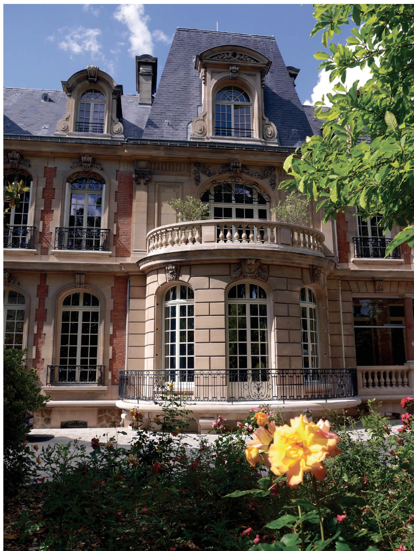
Hôtel de Ville de Gonesse (95) La menuiserie mise en œuvre est une fenêtre de la façade Sud du bâtiment, dans le bow-window situé au rez-de-chaussée.