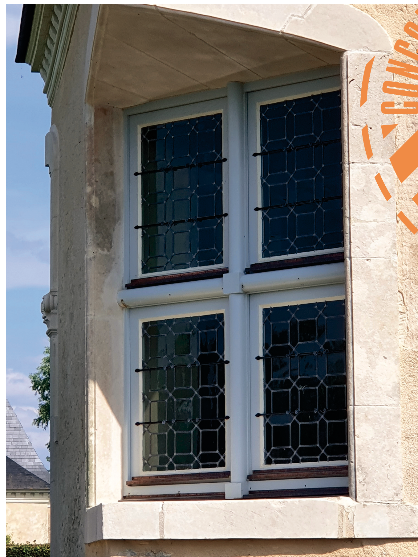
2 Manoir de Guiberne, Vallon sur Gée (72) Vue extérieure de la menuiserie.