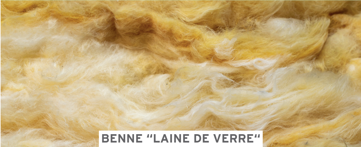
BENNE "LAINE DE VERRE" & BENNE "LAINE DE ROCHE"