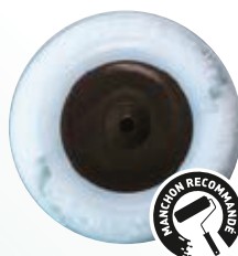
POLYESTER TISSÉ 4mm FIL CONTINU