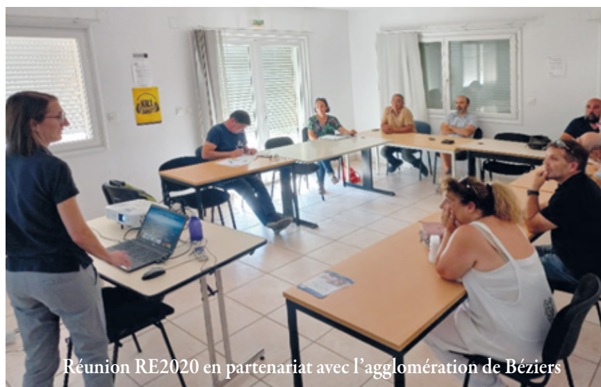
Réunion RE2020 en partenariat avec l'agglomération de Béziers

- Vendredi 07/10 (8h-10) : matinale juridique à la CAPEB Béziers