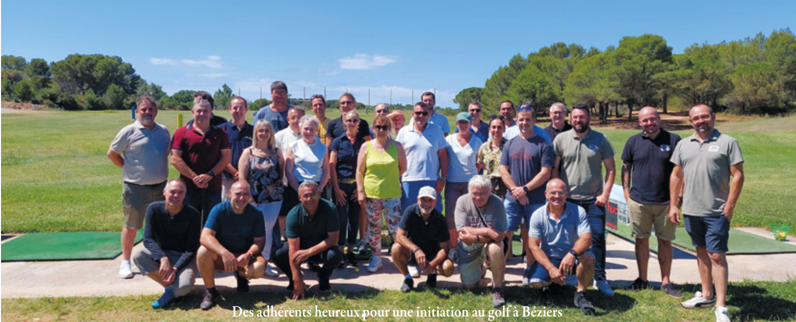
Des adhérents heureux pour une initiation au golf à Béziers