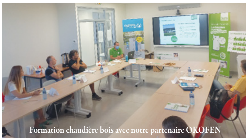
Formation chaudière bois avec notre partenaire OKOFEN

- Mardi 20/09 (8h-10h) : Prévention des risques et équipements de protection individuelle avec notre partenaire BAURES et l'OPPBTP (lieu : showroom de BAURES à Vendargues – 500 avenue de Bigos)