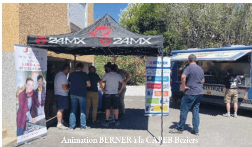
Animation BERNER à la CAPEB Béziers

- Vendredi 30/09 (17h) : Rénovation énergétique (salle communale saint Chinian)