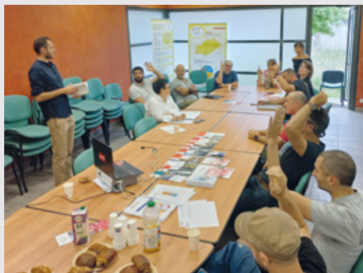
Réunion à Clermont - l'Hérault

Afin de présenter les enjeux aux artisans, une réunion d'information a été organisée le 30 juin dernier, par la CAPEB, au sein des locaux de la maison de l'artisanat, en présence du