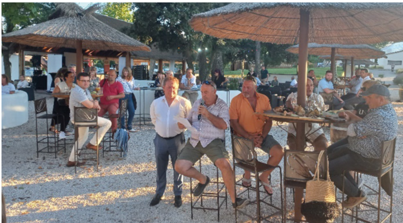
Une belle ambiance sympathique et conviviale à la manade du mas du pont

Le vendredi 24 juin en matinée, vous étiez une quarantaine au golf saint Jean à Béziers, pour vous initier au golf et partager un moment convivial autour d'un bon repas.