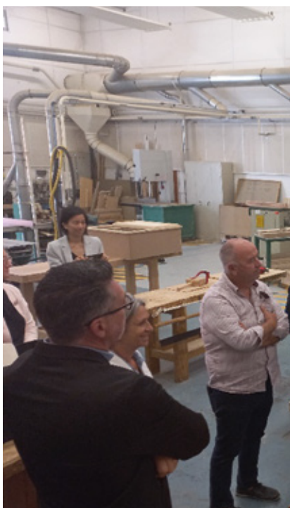
Visite de l'atelier menuiserie