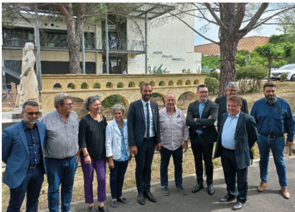
La délégation au complet devant la réplique du pont du Gard