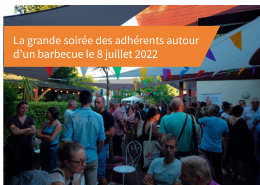
La grande soirée des adhérents autour d'un barbecue le 8 juillet 2022