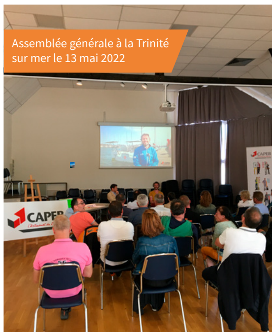
Assemblée générale à la Trinité sur mer le 13 mai 2022