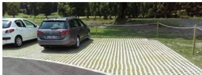
Parking végétalisé.

Le réseau CAPEB/CNATP peut informer et solliciter les entreprises intervenant sur ce type de chantier. N'hésitez pas à nous contacter pour impliquer les entreprises de vos territoires.