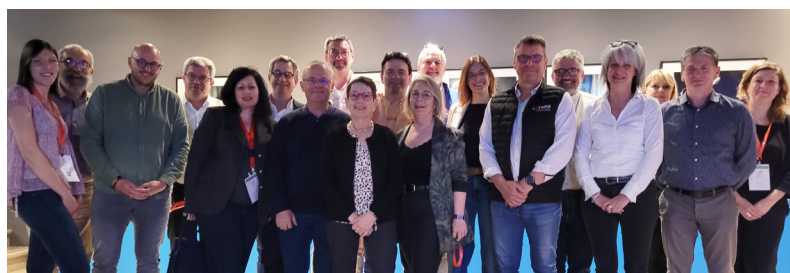
Présidents, administrateurs, secrétaires généraux et collaborateurs des Pays de la Loire.

Une délégation des Pays de la Loire et de ses départements (photo ci-dessous) s'est rendue à Paris pour assister à l'assemblée générale et au congrès de la CAPEB, les 11 au 12 avril derniers. Le débat consacré à l'attractivité des métiers du bâtiment, en présence de trois membres du gouvernement, a constitué l'un des temps forts du congrès, témoignant de l'engagement des pouvoirs publics en faveur de ce secteur clé.