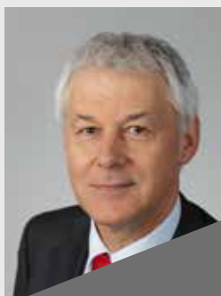
RENCONTRE avec Daniel LENOIR , Président de la Communauté de Communes du Mont des Avaloirs (CCMA) en Mayenne (53)