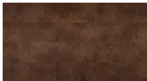
Original, décor Atlas