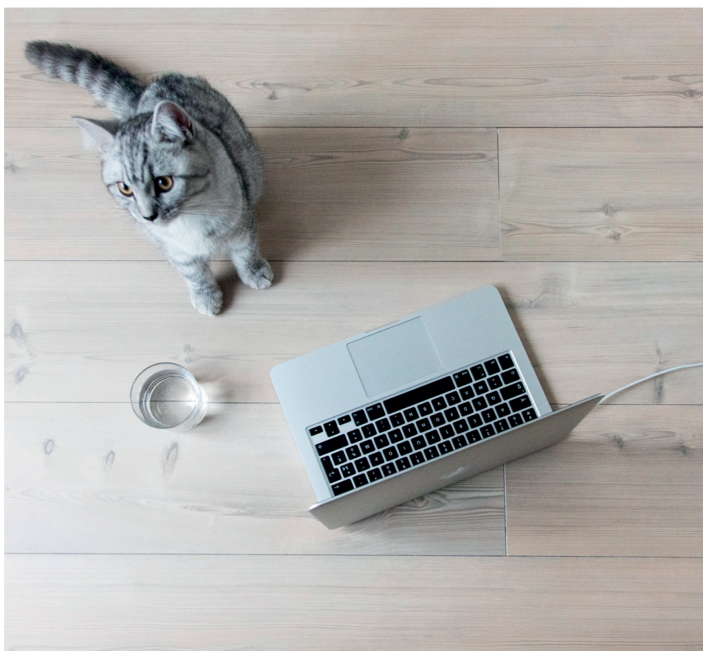
Original, décor White Pine

Depuis sa création, BerryAlloc a su rester fidèle à ses fondamentaux : une très haute qualité, souvent inégalée sur le marché, alliée à une technologie avant-gardiste. La marque conçoit des sols esthétiques, durables et performants plébiscités chaque jour par les prescripteurs les plus exigeants. La nouvelle collection de sols Haute Pression, destinée à la fois au secteur tertiaire et au grand public, est une belle démonstration du savoir-faire de ce spécialiste du revêtement de sol. Elle constitue une offre décorative qui regroupe des sols stratifiés reconnus pour être les plus résistants au monde. Ces stratifiés sont déclinés en 74 décors élégants qui trouveront naturellement leur place dans les univers à fort trafic.