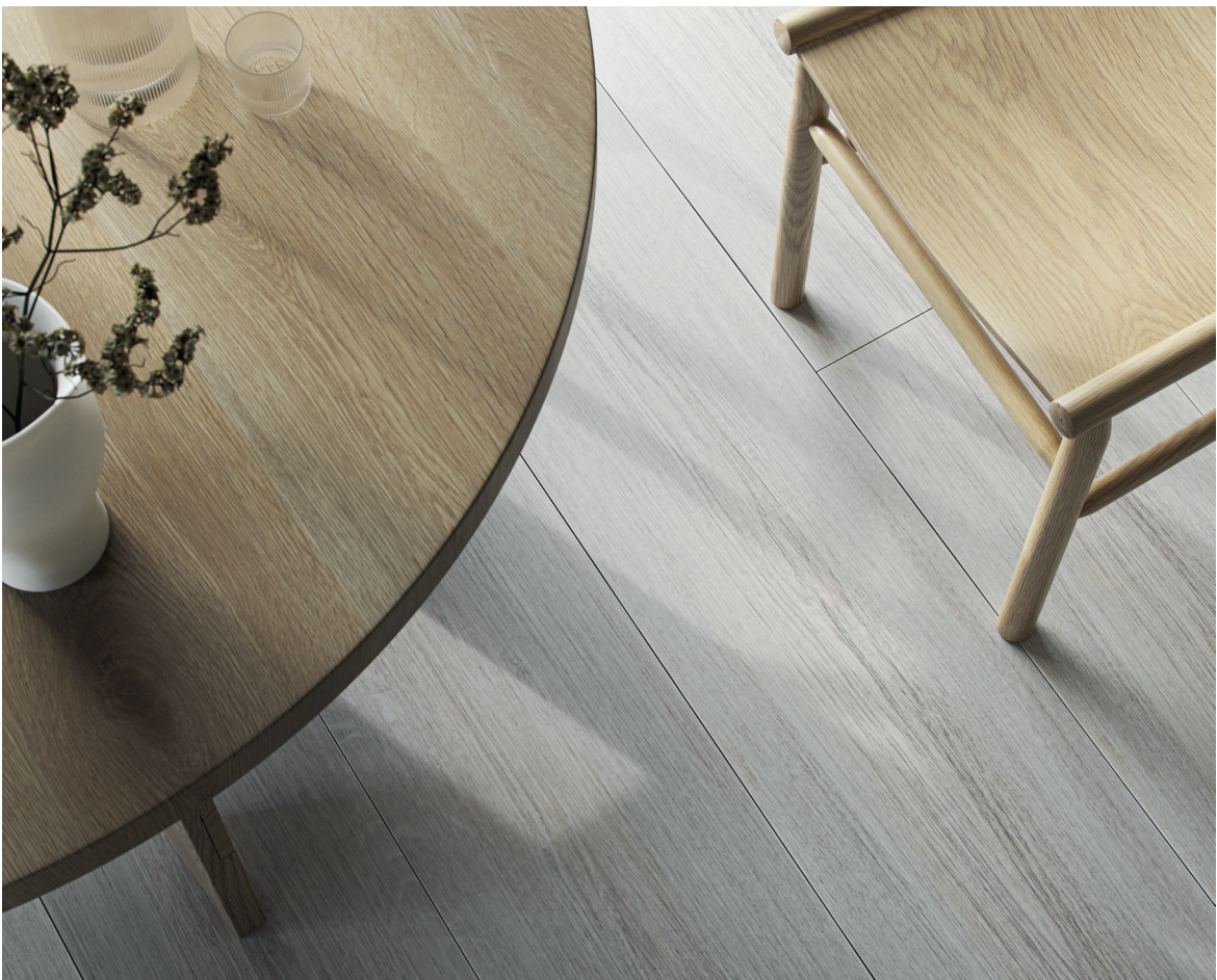
Grand Majestic, décor Katla Artic

Grand Majestic déroule 8 décors bois très réalistes, avec des veinages, des nœuds apparents et certaines irrégularités très réalistes, mis en valeur par une finition huilée. Les teintes vont du bois très clair notamment avec le décor Katla Artic au brun, à l'image du décor Etna Brown.