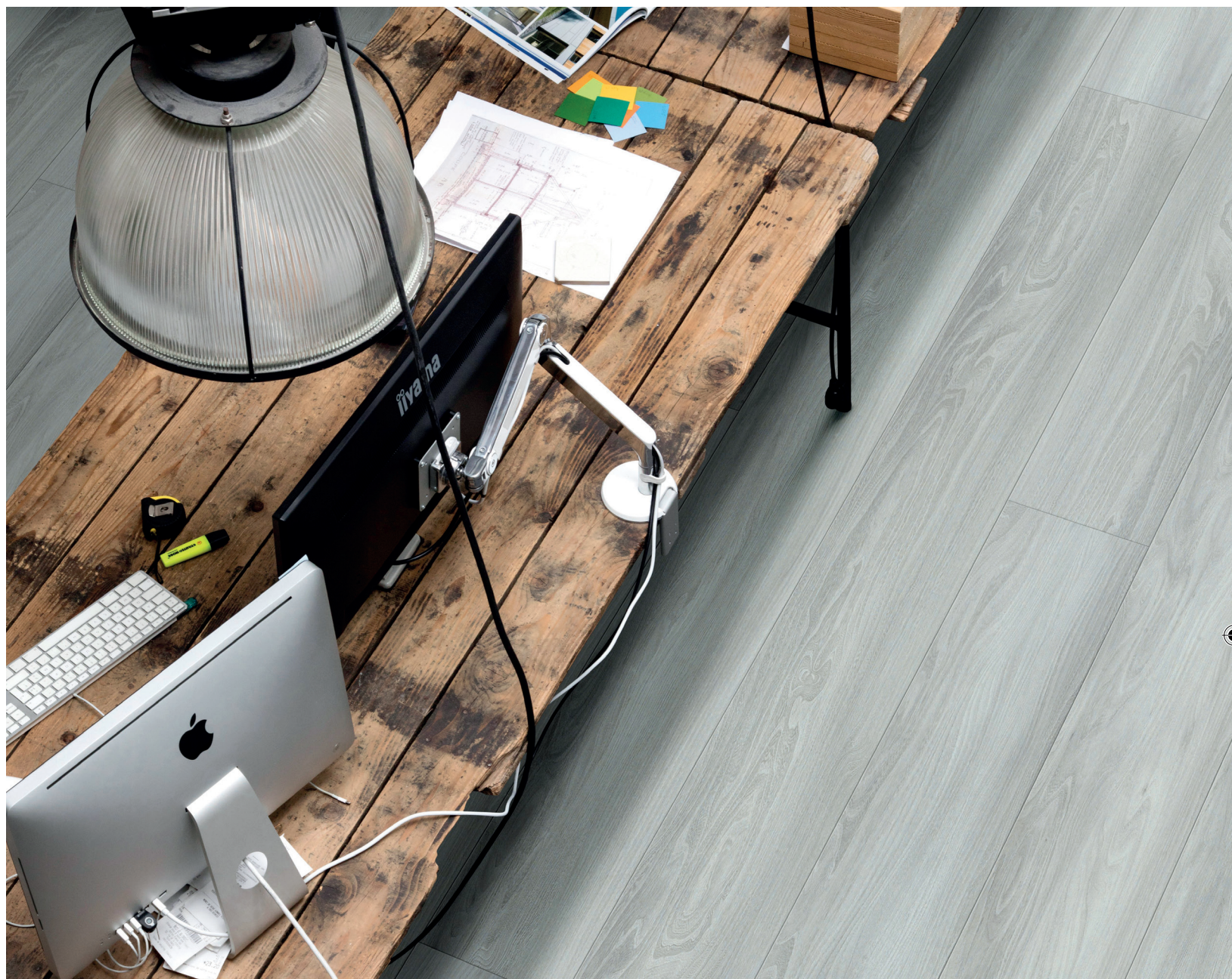
Grand Avenue, décor Magnificent