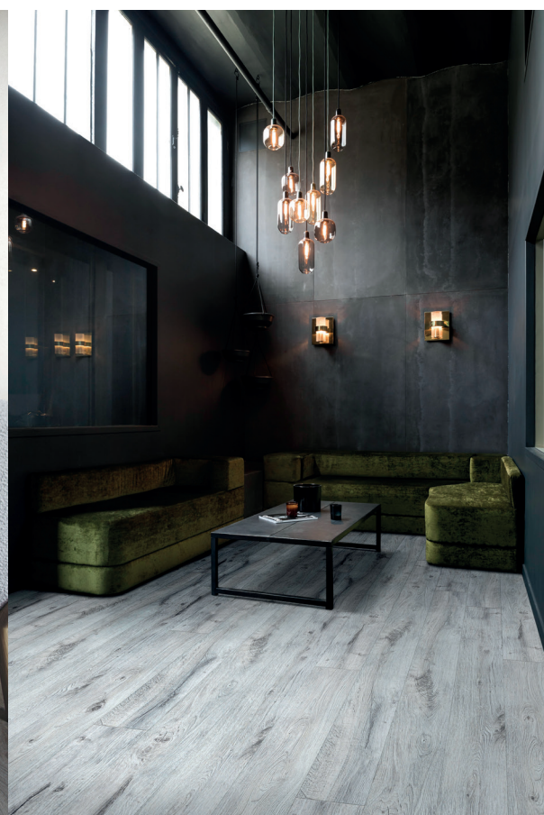
Grand Avenue, décor La Rambla