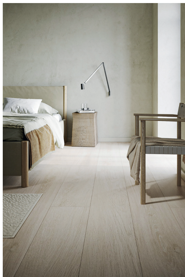
Grand Avenue, décor Via Monte

Le décor Via Monte met en avant un décor bois classique travaillé dans une délicate et lumineuse teinte miel.