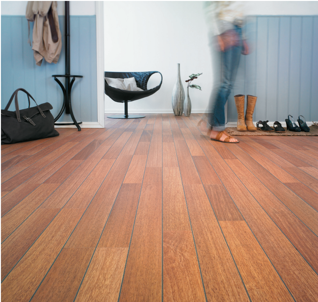
Original, décor Pont de bateau Oiled Shipdeck

Original , le best-seller des sols haute pression BerryAlloc.